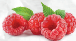
Purea di lampone